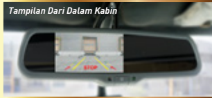
Tampilan Dari Dalam Kabin

Memudahkan pengemudi melihat area belakang melalui spion tengah saat mundur.